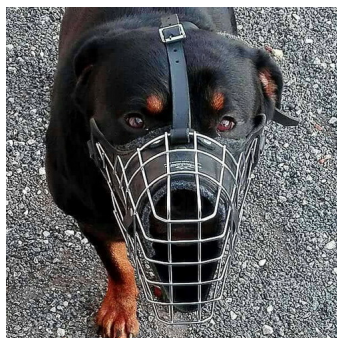
Kaganiec metalowy dla psa