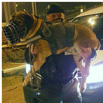
Profesjonalny kaganiec bojowy