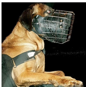
Metalowy kaganiec do s?u?by dla psów