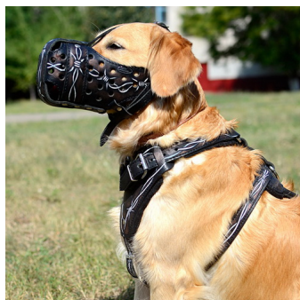
Solidny kaganiec dla Golden Retrievera «Drut kolczasty»