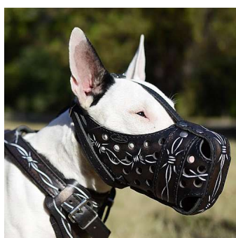
Solidny kaganiec dla PitBulla «Drut kolczasty»